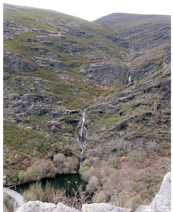
Corga da Louseira