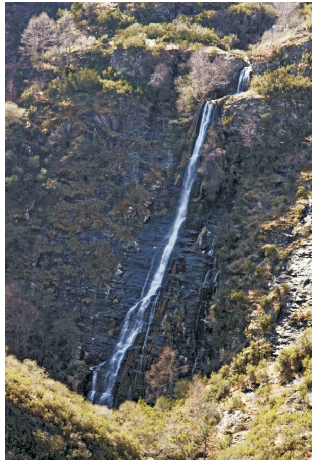
Corga do Val do Cenza