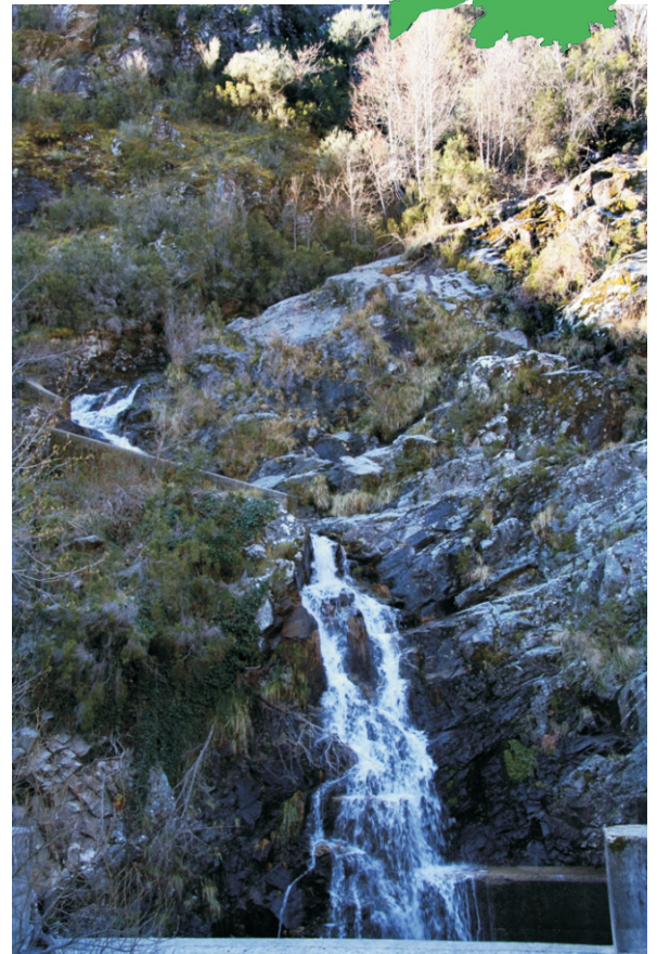
Corga do Reboredo-Gorbias